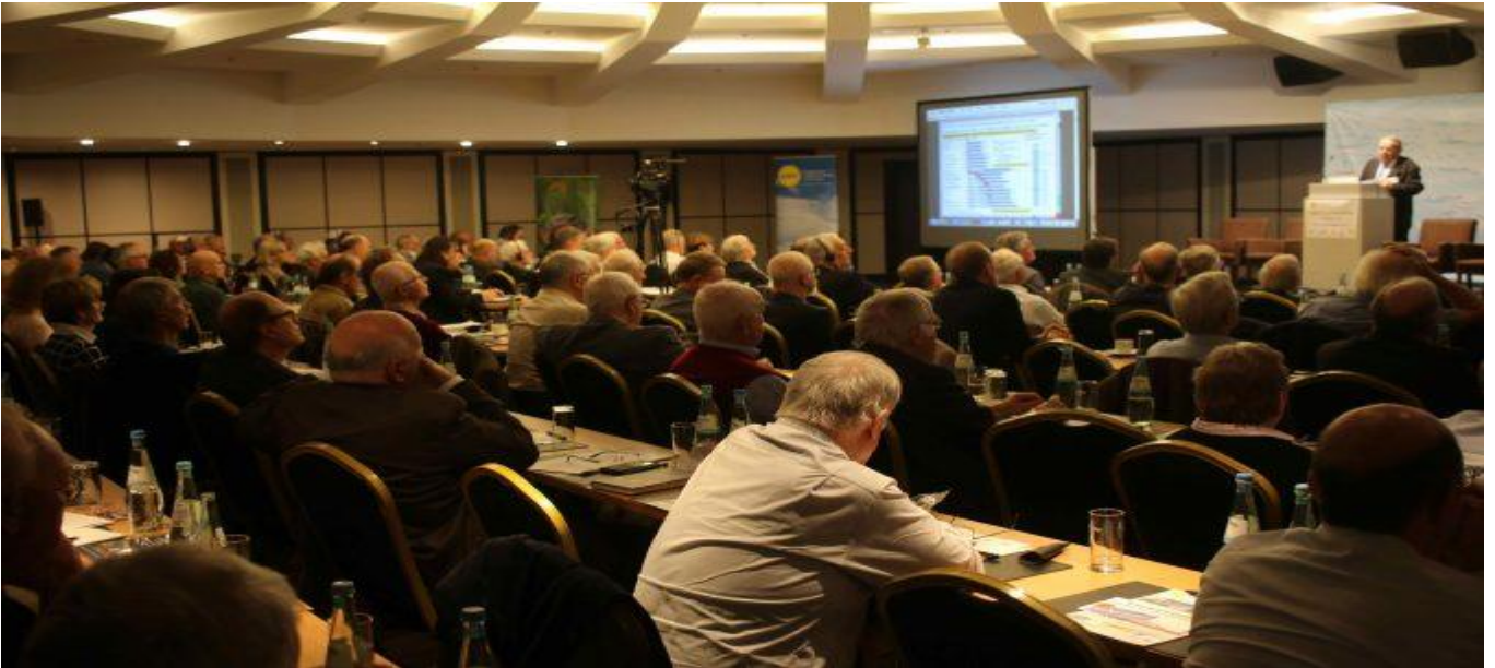
11. IKEK Teilnehmer Nikko Hotel Düsseldorf, 10.11.17

Die soeben zu Ende gegangene 11. Internationale Klima- und Energiekonferenz war eine der erfolgreichsten der letzten Jahre. Und dies in vieler Hinsicht. Sowohl was die Zahl und die Kompetenz der vielen Teilnehmer anging, als auch deren internationale Vernetztheit. Bewusst als Gegenveranstaltung von der durch Gier und Machtwillen geprägten COP 23 mit über 25.000 Teilnehmern konzipiert, deren einziges Bestreben es ist, am großen Umverteilungskuchen teilzuhaben, zeigte diese Konferenz, dass es nicht Masse braucht um die Klimaentwicklung zu erforschen, sondern Klasse und wissenschaftliche Lauterkeit. Dass die Mainstream-Medien diese Konferenz wieder mal komplett ignorierten, versteht sich fast von selbst.